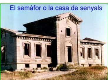
El semàfor o la casa de senyals

A la sorra ha de quedar per cent anys més durar