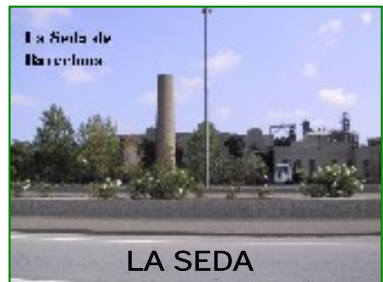
La Seda de Barcelona

La Seda va deixar de fumejar, la xemeneia ens l'ha de recordar