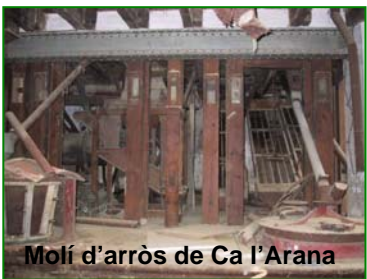
Molí d'arròs de Ca l'Arana

Cau la teulada, aixafa el molí, que més haurà de venir?