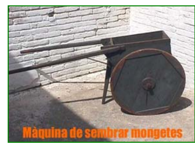
Màquina de sembrar mongetes

Molt parlar del Museu i on carai l'amagueu?