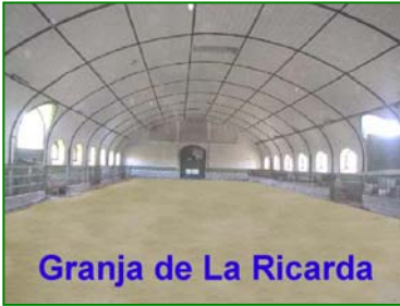
Granja de La Ricarda

Presentada la diada de Sant Jordi de l'any 2003