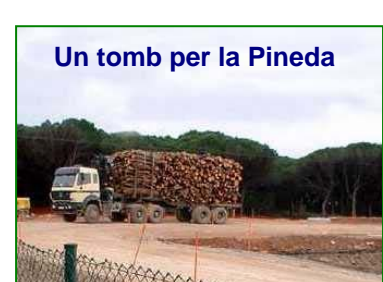
Un tomb per la Pineda

Fes un tomb per la pineda i explica'ns el que queda