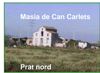
Masia de Can Carlets

Ens queden poques masies, tu les enderrocaries?